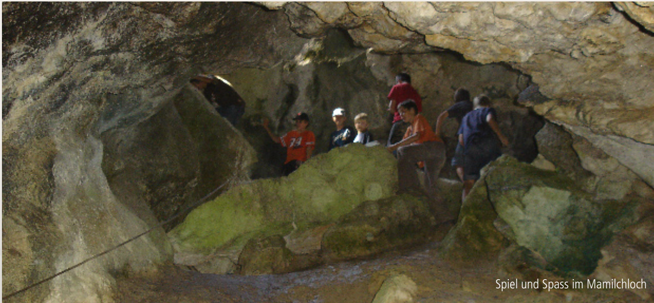
Spiel und Spass im Mamilchloch