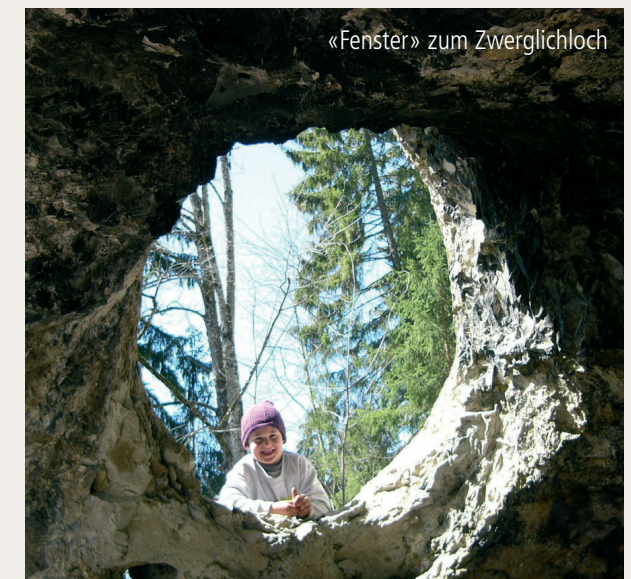
«Fenster» zum Zwerglioch

www.hoehlenpfad.ch oder www.schnurenloch.ch info@schnurenloch.ch