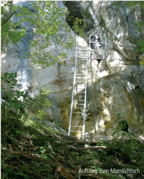
Aufstieg zum Mamiloch