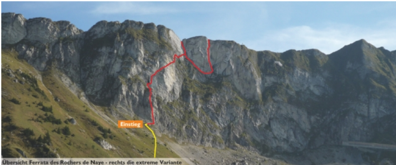
Übersicht Ferrata des Rochers de Naye - rechts die extreme Variante