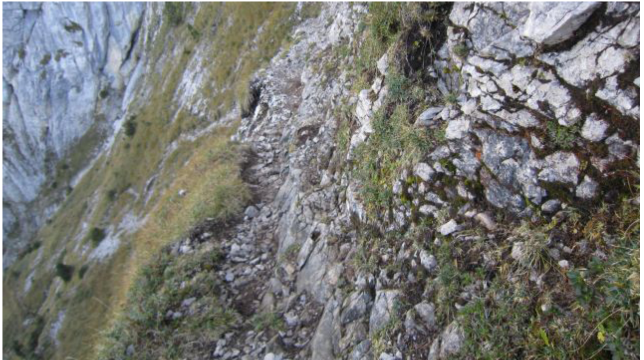
• T4 Bärenpfad