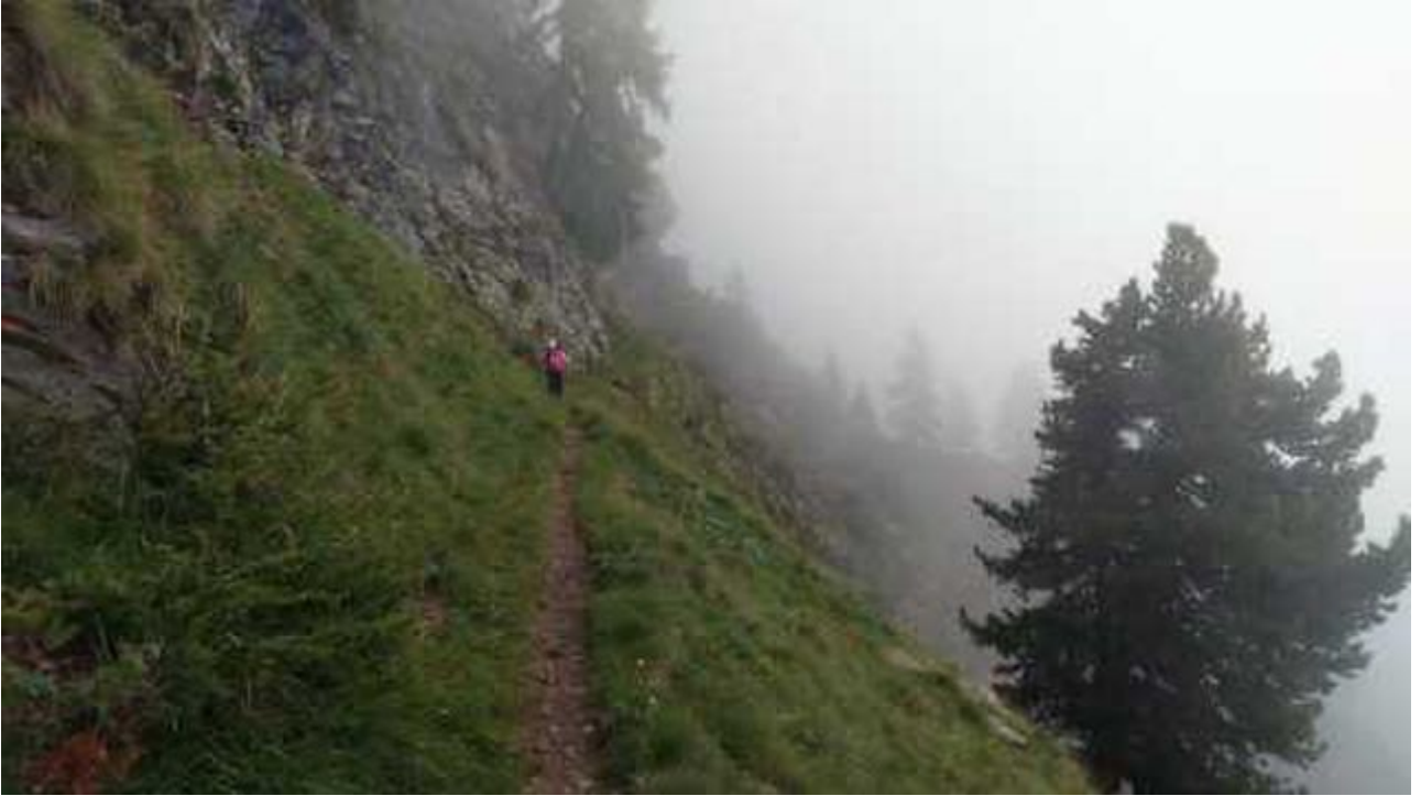
T3 Moosalp March